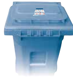
RECYCLING 回收 RECICLAJE

Para obtener más detalles, visite RepublicServices.com/municipality/alhambra-ca .