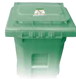
YARD & FOOD WASTE 堆肥 ABONO