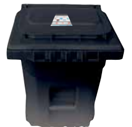
TRASH 填埋場 RELLENO SANITARIO