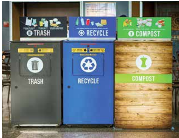
Front-of-house bins for customer use

Assembly Bill (AB) 827, which was signed into law in 2019, requires that businesses, such as restaurants and malls, make composting and recycling receptacles accessible to customers for materials purchased on their premises. AB 827 works collectively with commercial recycling and organics recycling mandates to maximize landfill diversion and reduce greenhouse gas emissions. If you provide disposal containers for customers, you must supply visible, easily accessible and clearly marked bins for recyclables and organics (compost) next to trash bins. Full-service restaurants must provide properly labeled bins for recyclables and compostables next to the trash containers used by kitchen and dining room staff.