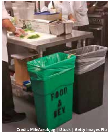
Kitchen prep area with a composting bin for staff use

Para establecer un programa de reciclaje que satisfaga las necesidades de reciclaje y desechos sólidos de su propiedad, llame a Connie González al 747.292.7096 o envíe un correo electrónico a alhambra@republicservices.com .